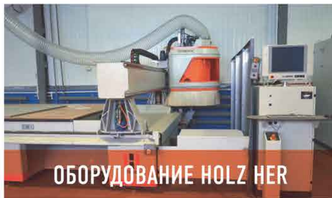
ОБОРУДОВАНИЕ HOLZ HER

Изготовление деталей по чертежам или образцам заказчика. Обработка производится на современных токарных станках с ЧПУ и на фрезерных обрабатывающих центрах Holz Her.